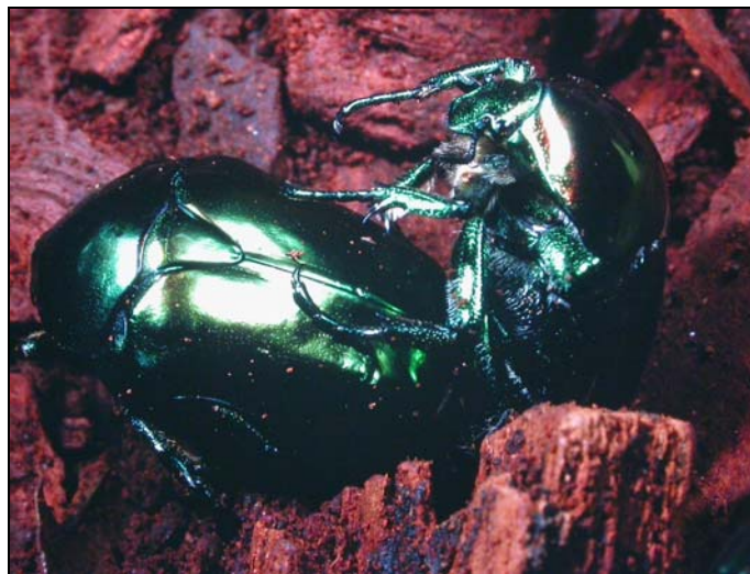
Cliché 2: accouplement de Cetonischema aeruginosa Drury .