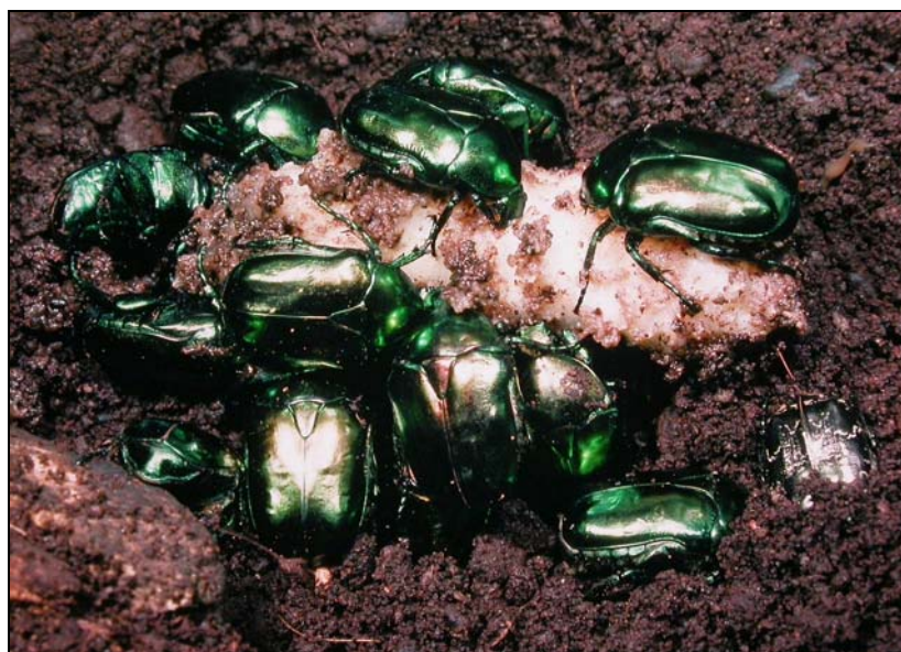
Cliché 1: imagos de Cetonischema aeruginosa Drury obtenus par élevage de larves trouvées dans une grosse cavité de chêne sénescant à Fontainebleau, parcelle « ventes à la reine ».

Des observations vérifient que les larves de cette espèce peuvent être localement extrêmement nombreuses lorsque le biotope est favorable avec de nombreux arbres sénescents; en particulier, D. Prunier a relaté l'observation d'une cavité volumineuse dans un vieux chêne sénescant abattu mais laissé sur place car sans valeur, dans la parcelle «ventes de la Reine » de la forêt Fontainebleau (Seine-et-Marne), et renfermant 200 larves au dernier stade L3, ce qui est particulièrement important. Ces larves qui étaient à brève échéance condamnées, ont pu être prélevées et maintenues en terrarium. Elles ont ainsi donné un fort pourcentage d'imagos viables (voir le cliché 1 illustratif suivant) ; ceux-ci ont pu être relâchés dans la nature une fois complètement matures.